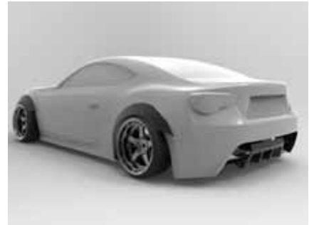
○タミヤ86に取り付けると約全幅203mmぐらいです。 ※URAS TYPE-GT用 リアディフューザーも使用。