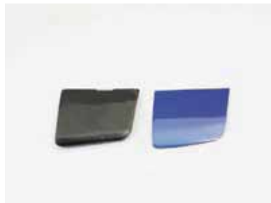
ヘッドライトカバーは大きさを適正化。