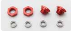
タミヤOP-2044用ホイールハブ